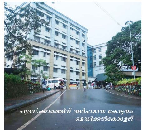
പുരസ്കാരത്തിന് അർഹമായ കോട്ടയം മെഡിക്കൽ കോളേജ്

മൂന്നുവർഷ കാലയളവിൽ 27.5 ലക്ഷം സൗജന്യചികിത്സ ലഭ്യമാക്കിയ ഇനത്തിൽ 836.8 കോടി രൂപ കേരളസർക്കാർ വിഹിതമായും 259.56 കോടി രൂപ കേന്ദ്രസർക്കാർ വിഹിതമായും ചെലവഴിച്ചിട്ടുണ്ട്. കാര്യം ബൈബിറ്റി (കെ.ബി.എഫ്) പദ്ധതി പ്രകാരം ലഭ്യമാക്കുന്ന സൗജന്യചികിത്സയുടെ മുഴുവൻ തുകയും കേരളസർക്കാറാണ് വഹിക്കുന്നത്. 'കാസ്പ്' പദ്ധതി പ്രകാരം പ്രതിവർഷം ഒരു കുടുംബത്തിന് അഞ്ചു ലക്ഷം രൂപയുടെയും കെ.ബി.എഫ് പദ്ധതി പ്രകാരം ആജീവനാന്തം രണ്ടു ലക്ഷം രൂപയുടെയും സൗജന്യ ചികിത്സയാണ് ലഭ്യമാകുന്നത്. 'കാസ്പ്' പദ്ധതിയിൽ ഉൾപ്പെടാത്ത, മൂന്നു ലക്ഷം രൂപയിൽ താഴെ വാർഷികവരുമാനമുള്ള എല്ലാ കുടുംബങ്ങൾക്കും കെബിഎഫ് പദ്ധതിയുടെ ആനുകൂല്യം ലഭ്യമാകും. നിലവിൽ കേരളത്തിൽ ഈ പദ്ധതികളുടെ ആനുകൂല്യം 193 സർക്കാർ ആശുപത്രികളിലും 575 സ്വകാര്യ ആശുപത്രികളിലും ലഭ്യമാണ്.