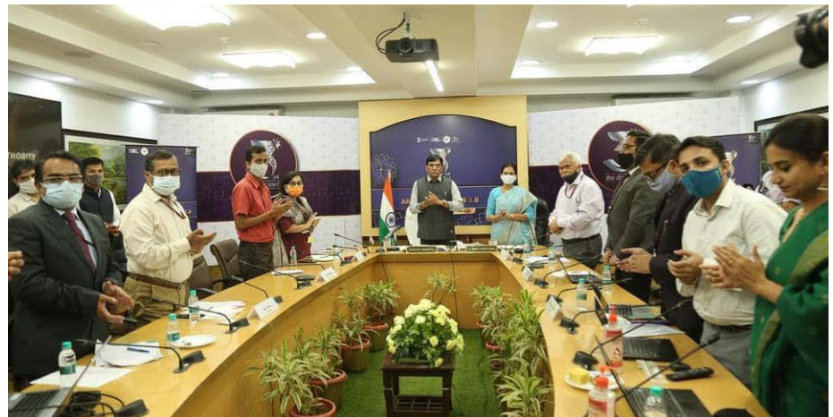
കേന്ദ്ര മന്ത്രി മൻസുഖ് മാൺഡവ്യ പുരസ്കാരങ്ങൾ പ്രഖ്യാപിക്കുന്നു